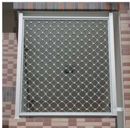
■集合住宅 廊下面に取付 格子：セレツソ+ヴィオラ 枠：2型 手摺枠に組込み